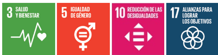
Ilustración ODS relacionados con el trabajo de la Fundación